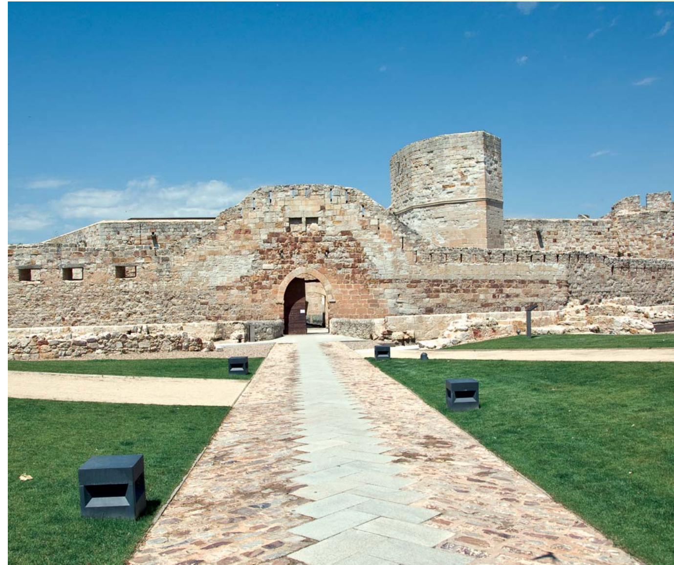
Castillo de Zamora.